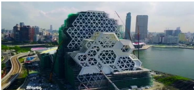
海洋文化流行音樂中心

本學位學程為考量市場需求及學生就業發展，以「兼顧就業與證照」、「發展在地觀光特色」及「未來國際觀光趨勢」，規劃「觀光旅遊」與「國際會展」雙模組課程，並結合本校跨系所之優異師資授課，邀請業界具實務經驗師資為後盾，配合校內相關會議展覽設備資源，以培育國際外語觀光導覽與專業會展實務人才。