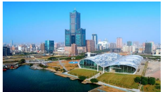
高雄世貿展覽中心